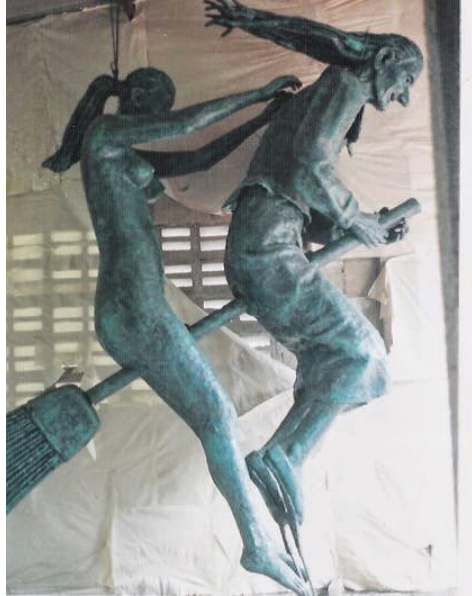
Estatua que se encuentra en el Aeropuerto Las Brujas

En 1610 en la ciudad de Cartagena, la Inquisición instala un tribunal como punto estratégico, con el fin de ejercer control sobre el Caribe. Este tribunal era muy importante, ya que al puerto llegaban muchos libros y la inquisición pedía a los comisarios que los examinaran rigurosamente con el objetivo de detectar alguno prohibido, para así evitar la entrada de nuevas herejías que obstaculizaran el proceso de cristianización.