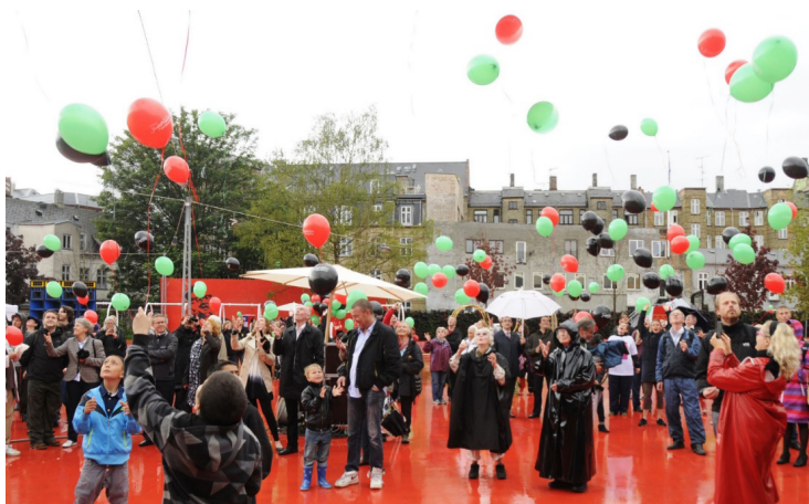
Imagen 2: Plaza Roja, actividades culturales.