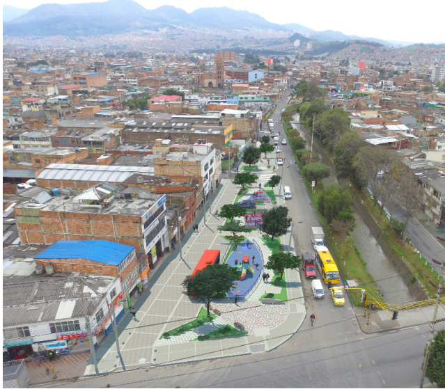
Imagen 12: Propuesta de intervención

A pesar de ser una intervención promovida por entidades públicas y estatales, con el fin de generar mayor identidad y apropiación del proyecto, la definición del diseño ha ido de la mano con las necesidades manifestadas por parte de la comunidad en la que se encuentra localizada.