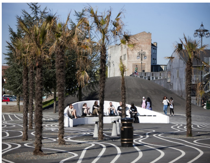
Imagen 3: Plaza Negra, espacios de estancia.