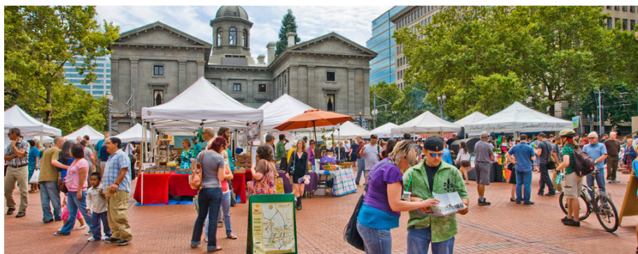
Imagen 5: Eventos Plaza Pioneer Courthouse

Actualmente la plaza se conoce como el “living room” de la ciudad y las actividades que se realizan en ella son gestionadas por una organización sin fines de lucro creada desde antes de su inauguración, que con la ayuda de voluntarios de la comunidad y contribuciones del sector privado, mantienen un modelo de gestión público-privado exitoso. 31