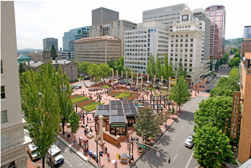
Imagen 4: Plaza Pioneer Courthouse