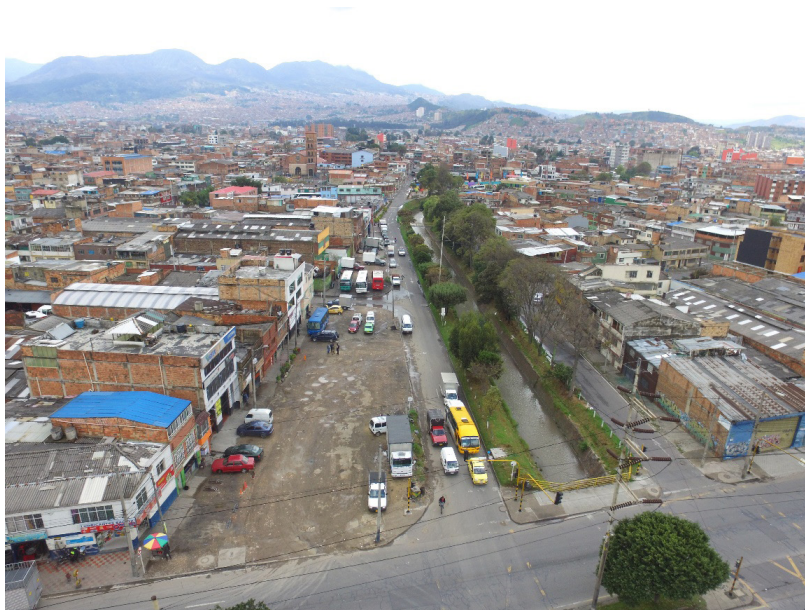
Imagen 12: Estado inicial