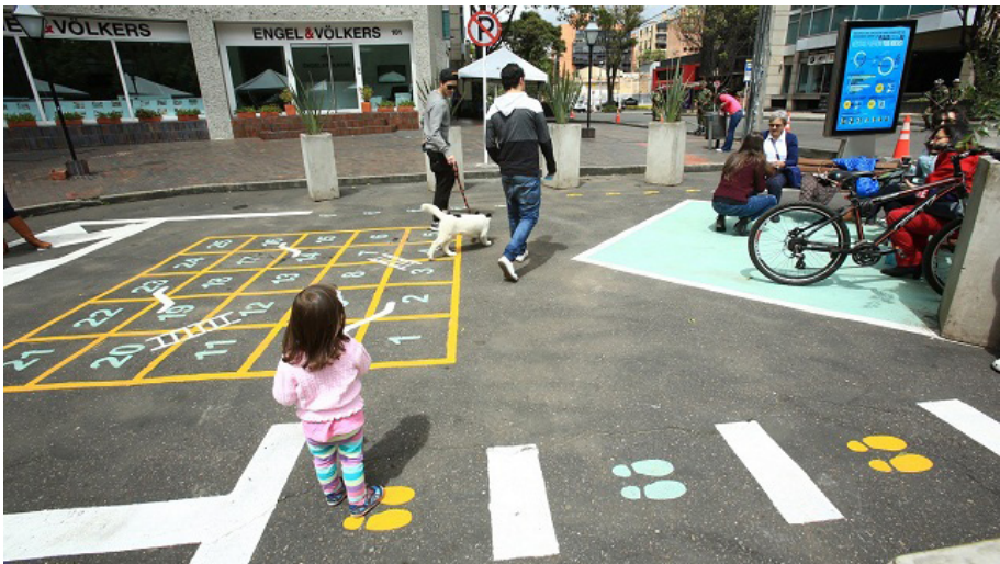
Imagen 11: Plaza 80, nuevas zonas de juego y estancia.