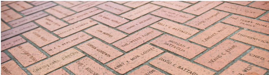
Imagen 7: Ladrillos Plaza Pioneer Courthouse