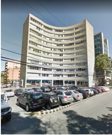
Imagen 9: Antiguo parqueadero.