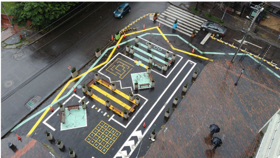
Imagen 8: Intervención Plaza 80