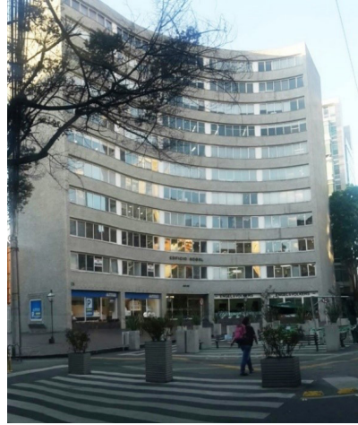
Imagen 10: Estado actual Plaza 80.