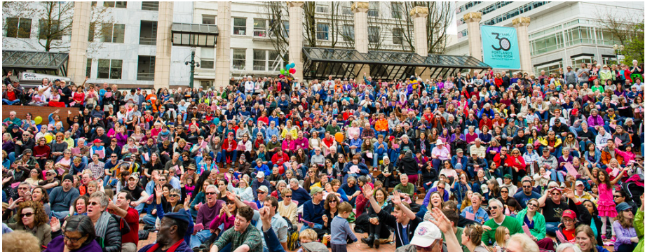
Imagen 6: Eventos Plaza Pioneer Courthouse