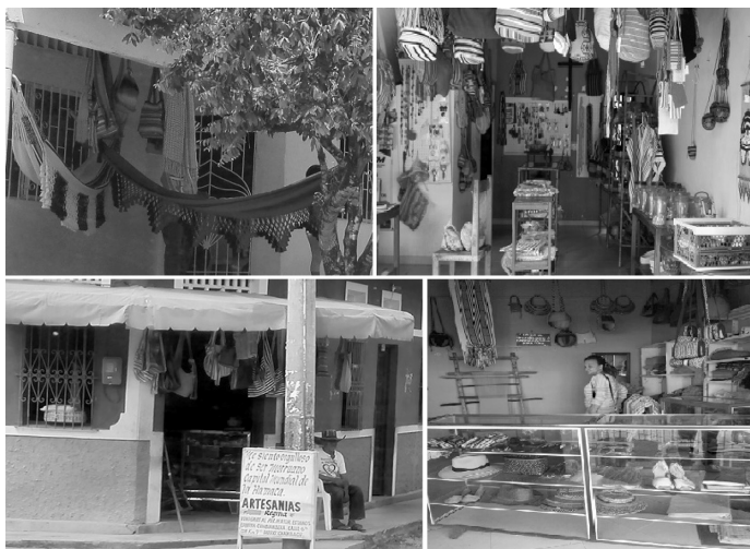
Figura 2. 2. Artesanías Morroa.

La mayoría de los establecimientos consultados se clasifican como microempresas, según la clasificación tributaria son empresas artesanales pertenecen al régimen simplificado.