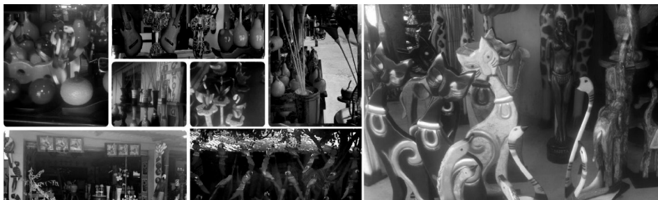
Figura 2.3. Artesanías Sampués.