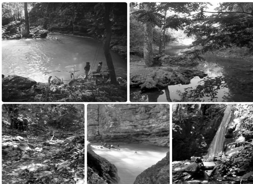
Figura 2.5. Pozas de Colosó.