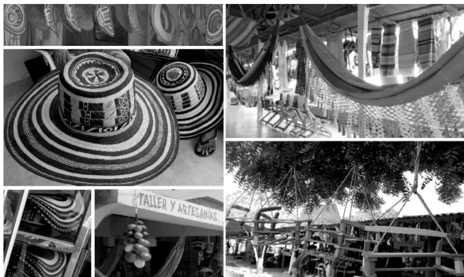
Figura 2.1. Artesanías Sampués y Morroa.

Entre los tipos de productos más ofertados y atractivos para el turista nacional y extranjero se encuentran los relacionados con mueblería (Mecedoras, sillas, juegos de cuarto, juegos de sala y comedor) y adornos en artesanía (servilletero, jarrones, floreros, frutas, decoraciones de animales como Gatos, Jirafas, Gansos, etc.), que corresponden a los más demandados, así como Hamacas y Sombreros (en especial el sombrero “Vueltaio”) y otros accesorios (Figura 2.1).