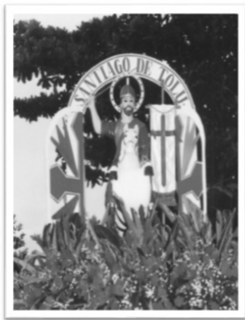
Figura 4. Imagen del Patrono de Santiago de Tolú