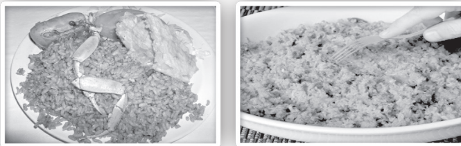
Figura 3. Platos Típicos de la Gastronomía de Santiago de Tolú

Los orígenes de esta manifestación están influidos también por la cultura paisa, proveniente de Antioquia, de donde se han traído sabores andinos que se han combinado con los sabores típicos de la costa Caribe. Así, es común encontrar preparaciones a base de caraotas uno de los cultivos más antiguas plantas americanas. La caraota es una de las once especies que alimentan al mundo. Se utiliza como alimento básico suministrando proteínas, calorías, vitaminas y sales minerales.