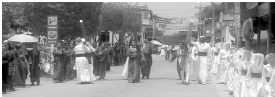
Figura 2. Procesión de Semana Santa - Santiago de Tolú