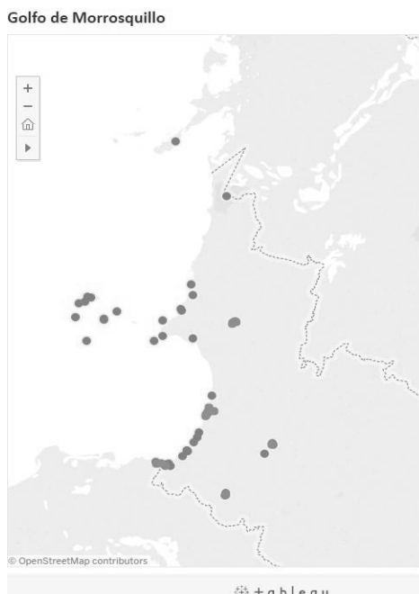
Figura 1. Golfo de Morrosquillo, Sucre

Los participantes logran el objetivo principal del taller que fue indentificar y ubicar en el mapa local la realidad del territorio, con respecto a la planificación del mismo desde la posición de cada uno de los niveles representados en el nativo afrodescendiente prestador de servicios turisticos informal y formal. Lo anterior, establecerá los niveles de precepción de éstos con respecto a su economía de subsistencia y propondra una mirada desde la visión comunitaria de quienes hacen parte de la comunidad local.