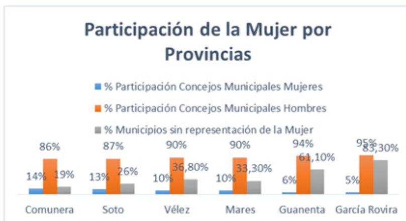
Gráfico 2. Participación de la mujer por provincias.

En la contienda electoral del período 2008-2011, a nivel de municipios, las mujeres alcanzaron representación en el 9.1%, en las alcaldías de 8 municipios. Mientras que en los Concejos Municipales lograron 82 curules de un total de 820. Lo que equivale al 10%, evidenciando un leve incremento en comparación con las elecciones anteriores. El panorama por provincias respecto de la participación de la mujer en los Concejos Municipales permite evidenciar que el porcentaje más alto se encuentra en un 14%, correspondiente a la provincia Comunera. Así mismo dos provincias se encuentran por debajo del 10%, como son la provincia de Guanentá con el 6%, y, García Rovira con el 5%.