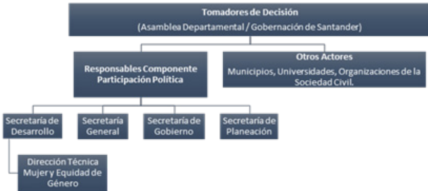
Gráfico 3. Estructura de funcionamiento.

El Componente de Participación Política y Representación para la Autonomía de la Mujer de la PPMEG se compone de 13 acciones, las cuales se pueden clasificar en cinco subgrupos, siendo estos: (i) Formación / Educativa, (ii) Liderazgo y emprendimiento, (iii) Investigación, (iv) Institucionales y (v) Promoción. Desde el diseño de la Política se asignaron responsables y actores en los diferentes objetivos y acciones planteadas. También, en ese sentido, se plantea como estructura de operación del mencionado componente, la siguiente: