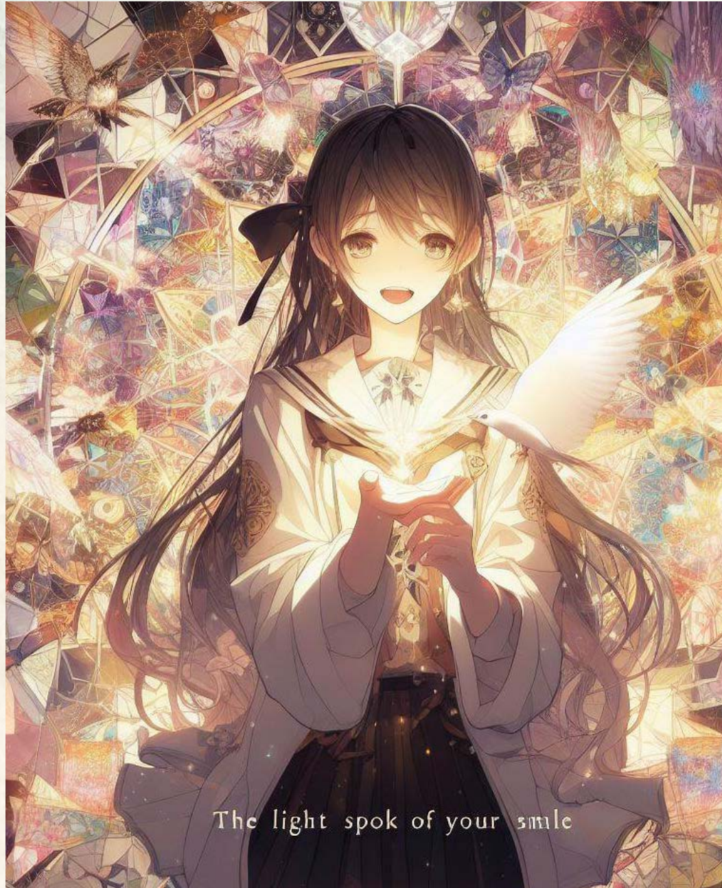
Imagen generada por Generador de imágenes Microsoft Bing