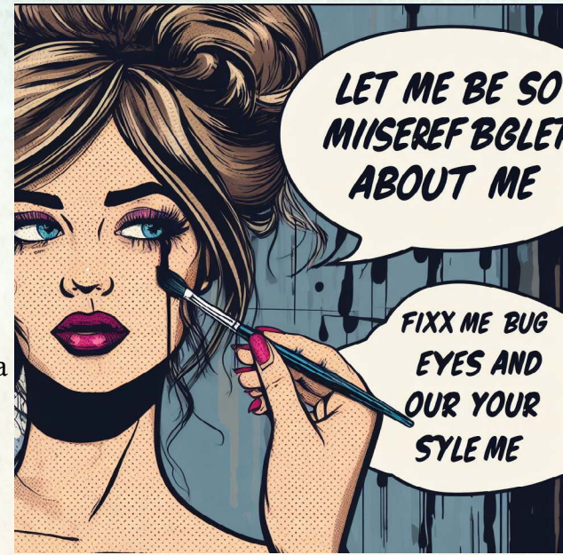
Imagen generada por Generador de imágenes Microsoft Bing