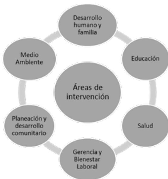
Figura 2 Áreas de intervención del trabajador social