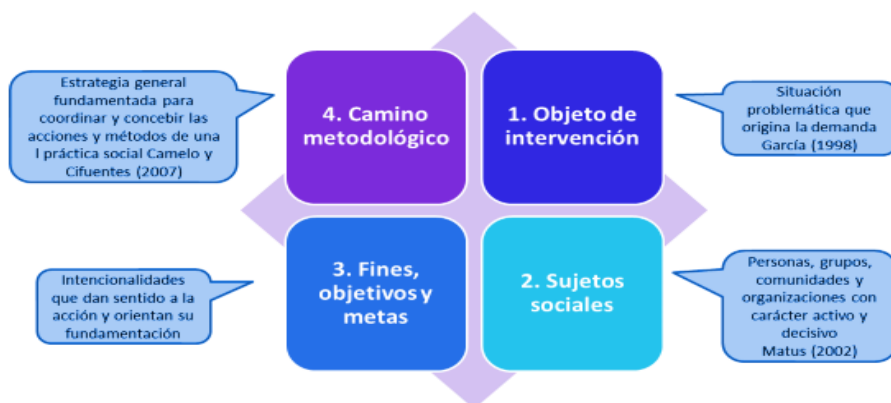
Figura 3 Componentes de la práctica

Nota. Fuente: Estructura pedagógica y teórica de la Práctica Profesional. Ruta RCPS (2019).